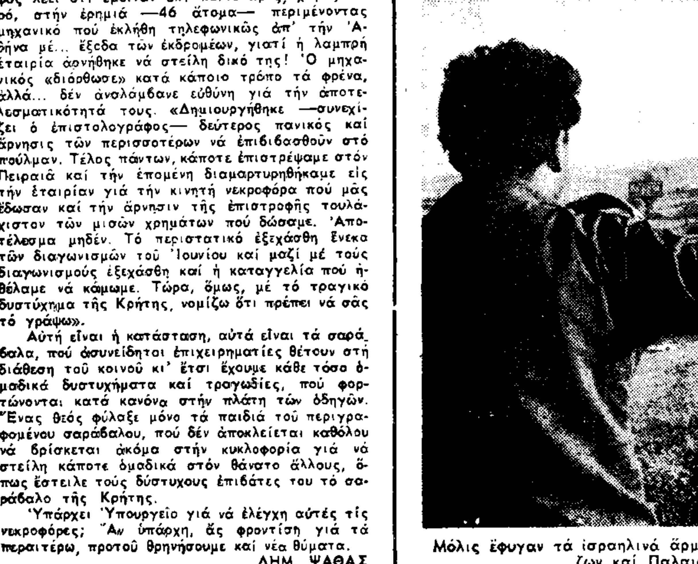
Μόλις έφυγαν τα ισραηλινά άρματα μάχη από τώ Νότιο Λίβανο, έξπασε η ρήξη μεταξύ Λιβανών και Παλαιστίνων άνα στρατόπεδο τώ Γιάσιν Άραφάτ.